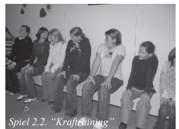
Spiel 2.2. „Krafttraining“