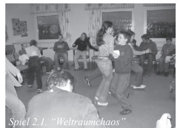
Spiel 2.1. „Weltraumchaos“